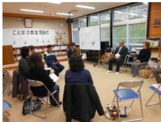
父母会・親の会結成