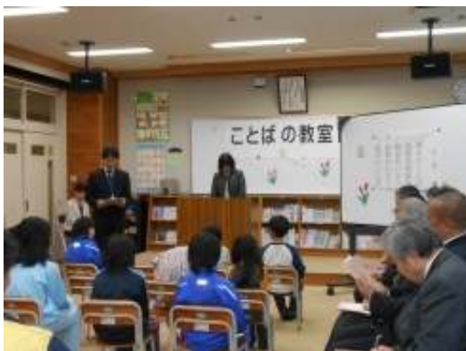
大芦校長先生挨拶