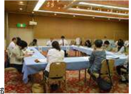
分科会:担当者の部