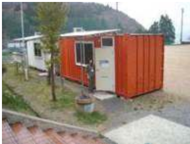
越喜来小学校 校庭に仮設のこたばの教室（コンテナ教室） 教室内・壁には通級児童の写真と決意！